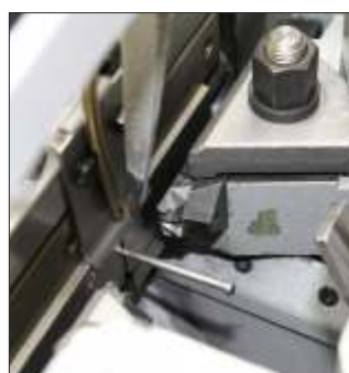
▲ Herstellung Blindnietstifte