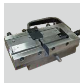
▲ Backenkasten (austauschbar)