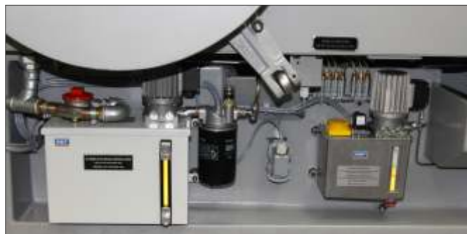
▼ Wartungseinheit und Automatische Öl-Zentralschmierung